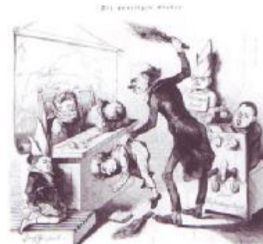
Sôres di penitances dins ene sicole e l' Almagne e 1849

Onk des mwaisses prindeut les efants pàs orayes ou bèn pàs tchveas ådzeu d' l' oraye et i saetchive foirt et les toide etot gueuyant des frâzes di colere. Ça lyi aveut valou on spot: « li râyeu d' orayes. »