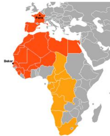
Les payis sovint trevâtchîs do raliye.

Sins compter qui des payis come el Marok, el Sènègal èy ètou l' Mauritanie croeyît dè profiter su l' plan locâ avou l' vinte des afères du cwin.