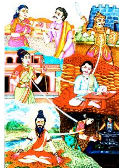
Imâdjès do restchâr n aedje [ réincarnation ]

efants d' Abrâm, direu dju Bén. Li Bon Diu, li Diale, Adam et Eve, li dloujhe [ déluge ] et l' Âtche da Noyé, Moïssse schapé des aiwes, il î croeynut tertos. Veyou d' Pekin u del Nouve Deli, ki t' fouxhes djwif, muzulman u crustin, c' est todi l' minme diale (sapinse li martchand d' bondius).