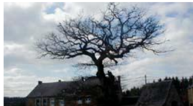
Ombion do vî tchinne di Presgå

Èn âbe foû-ordinaire, c' est èn âbe ki n' rishonne nén às ôtes, soeye-t i k' il a crexhou tot crawieus (fâ d' Verzi), soeye-t i k' il est nouzome (secoya), ubén k' il est vî vî et k' i vike co.