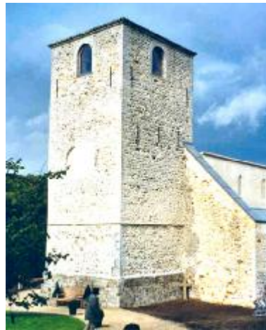
Li viye egljhe di Lîssin, e pires di tawea

Troejhinnmint li hoye , k' est dins l' fond. C' est pâr on maxhâd ki rshonne âs rotches castinnixheuses volcanikes, çoula, edon ?