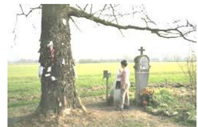
L' âbe às clâs d' Erciye

Gn a eto des âbes k' ont stî eployîs po des pratikes a vey avou les doûcès croeyances come les âbes às clâs. Insi, a Erciye , gn a la on tchinne ki les djins î vnèt agritchî des esvotos, dj' ô Bén, des lokes avou ene dimande po-z esse egzocé di Sint Antoenne.